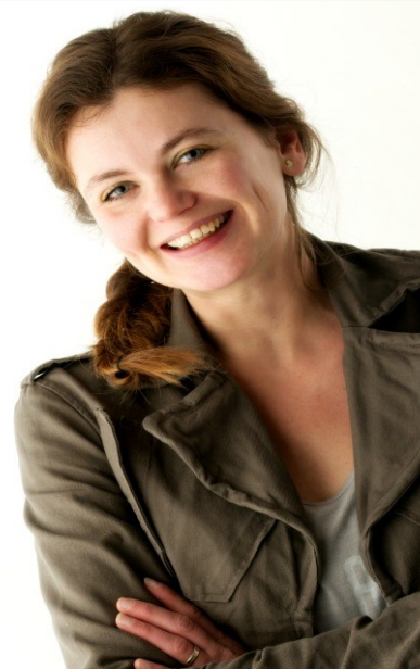
Deze maand: De zorg voor morgen begint vandaag

6 december van 09.45-10.45 uur gratis inloopsprekuren. Elke eerste dinsdag van de maand: adres: Oude Molenweg 14 in de Mortel